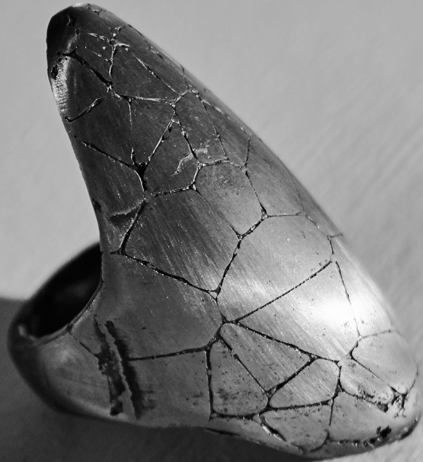
"Gila" Sörmus, Malm, 4 cm, 2021