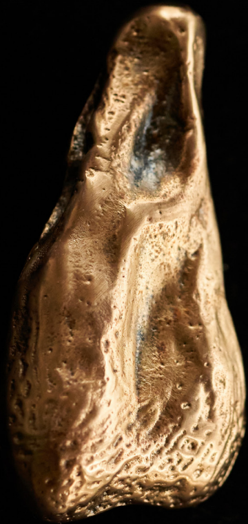
Rinnanõel, pronks, 11 x 5 cm