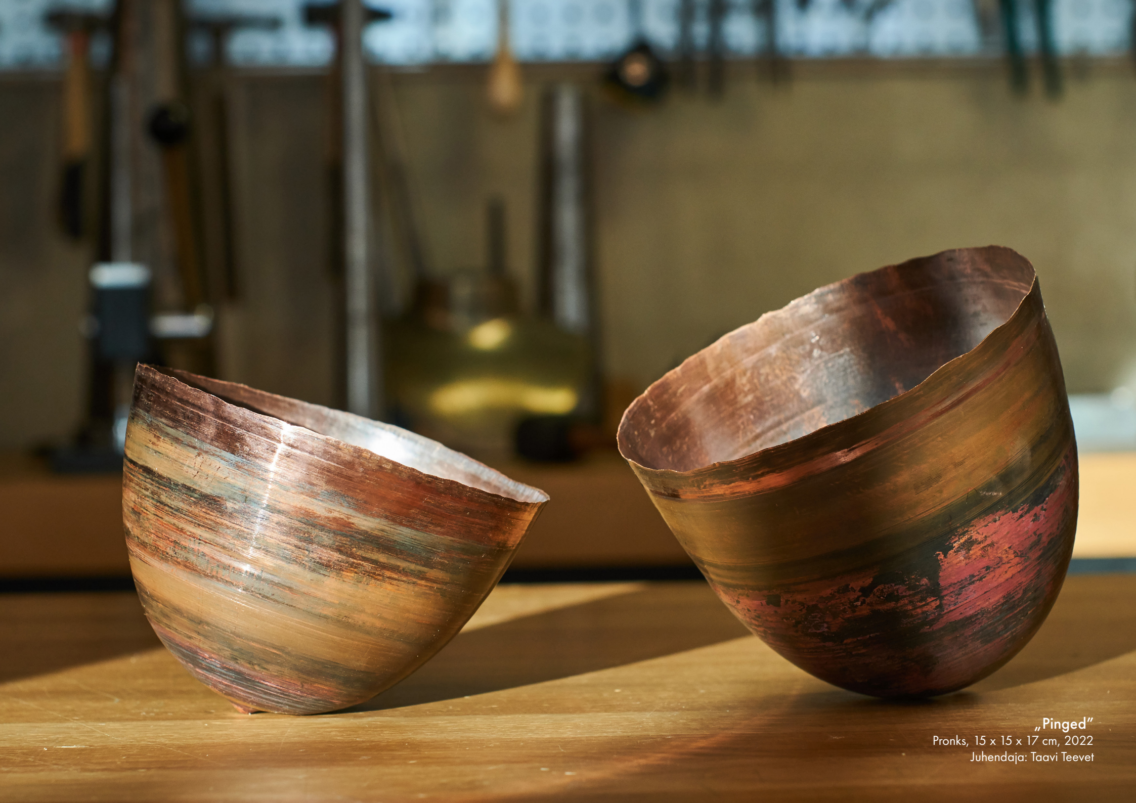
„Pinged“ Pronks, 15 x 15 x 17 cm, 2022 Juhendaja: Taavi Teevet