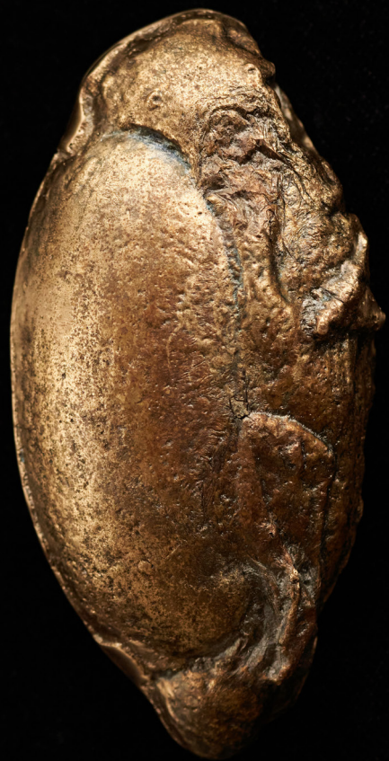
Rinnaehe, pronks, 11 x 6 cm