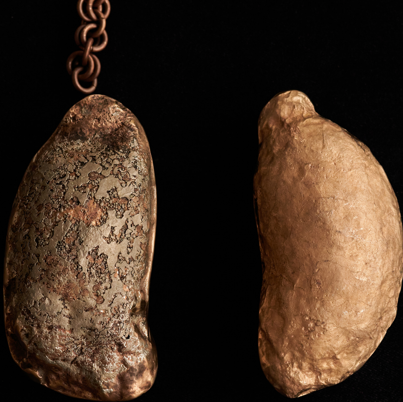
Kahahe, pounks, 14 x 7 x 5 cm