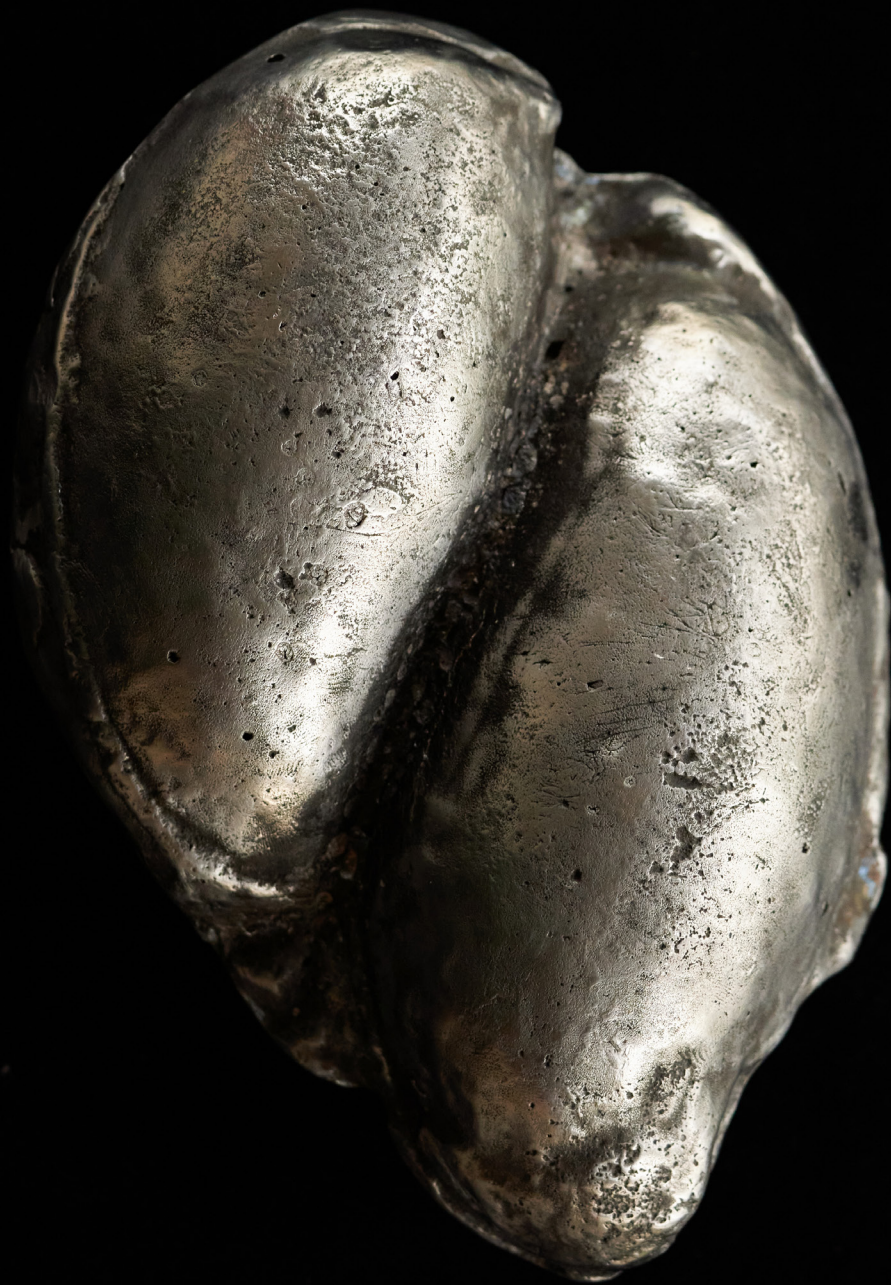
Kaelahe, alumiinium, 17 x 8 cm