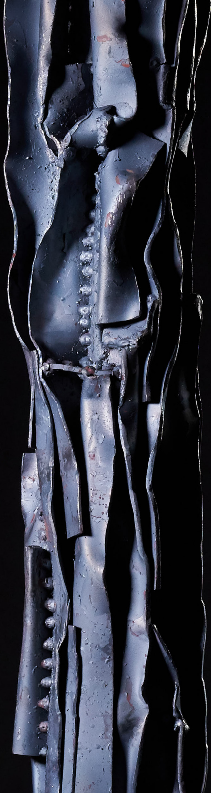
„Mürkel“ Teras, 15 x 15 x 110 cm, 2021 Juhendaja: Nils Hint