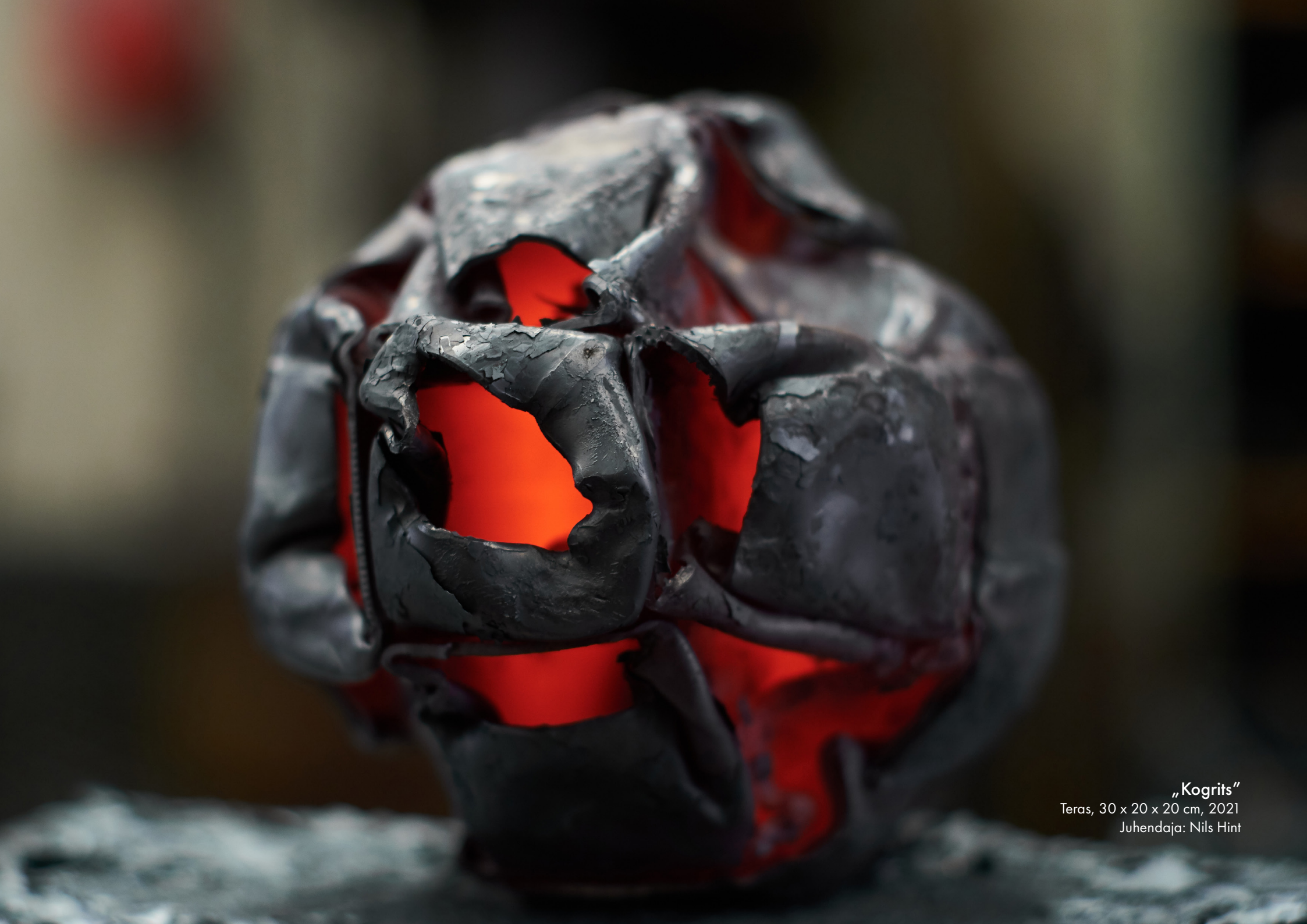
„Kogrits“ Teras, 30 x 20 x 20 cm, 2021 Juhendaja: Nils Hint