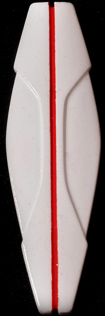
"Salk" Körvaehe, SLA-print, 5 cm, 2019