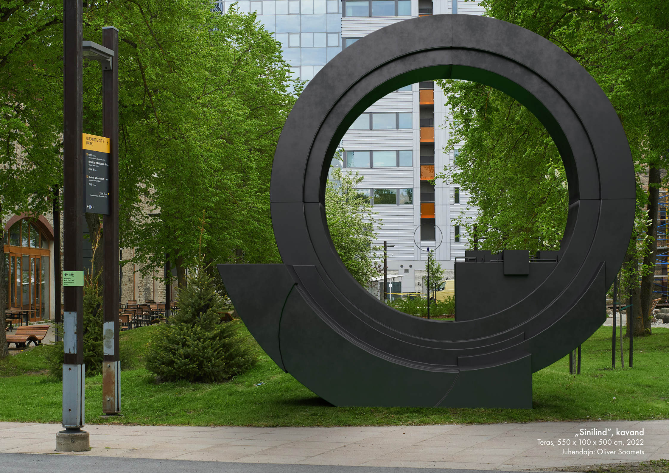
„Sinilind“, kavand Teras, 550 x 100 x 500 cm, 2022 Juhendaja: Oliver Soomets