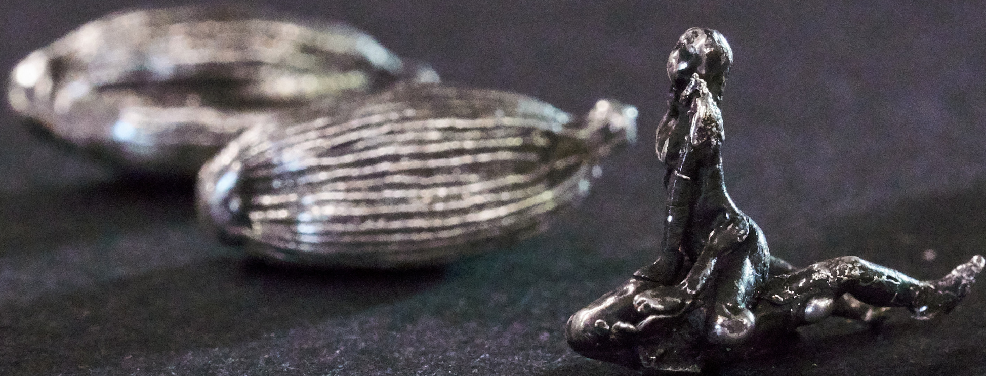
„Ühe“ Höhe, 1,5 x 1 cm, 2022 Juhendaja: Erle Nemvalts