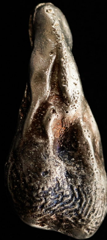
Rinnanõel, pronks, 11 x 5 cm