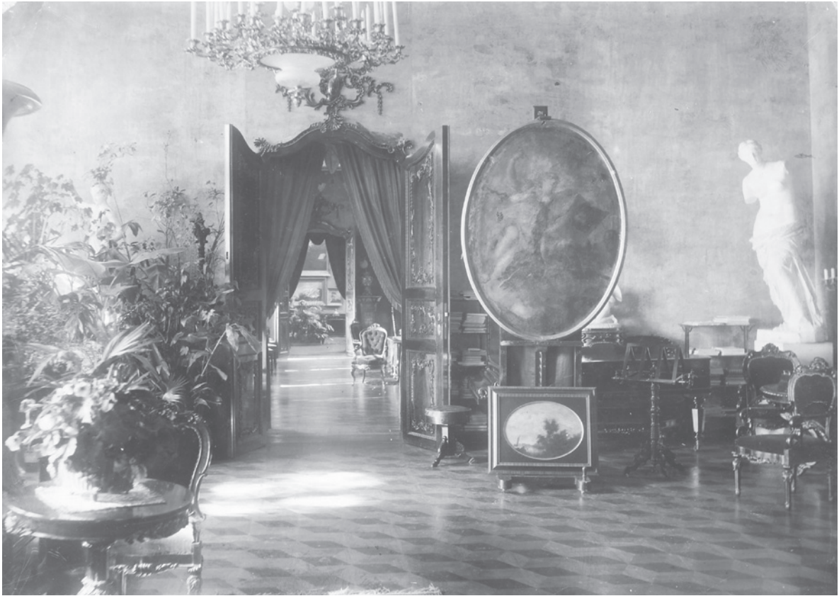
4. Raadi mõisa sisevaade.

Hävinud / Interior view of Raadi (Ratshof) manor. Not preserved.