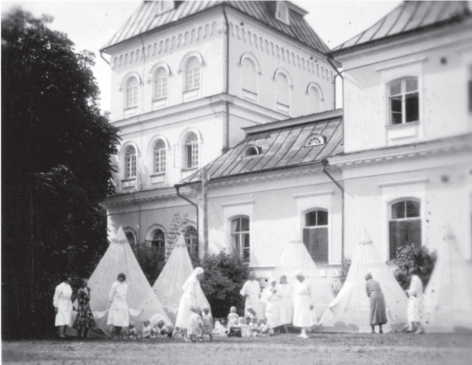
6. Kaagvere mõisa rajati lastekodu 1926. aastal. Ülesvõtte pärineb diplomaatilise korpuse poolt Konstantin Pätsile kingitud albumist ja on tehtud välisdiplomaatide ringreisil Eestis / An orphanage was established at the former Kaagvere manor (Kawershof) in 1926. The photograph is from an album given to (later Estonian President) Konstantin Päts by the diplomatic corps and was taken during a tour of Estonia for foreign diplomats. Tundmatu fotograaf / Unknown photographer, 1931. Rahvusarhiiv / National Archives of Estonia, ERA.I278.I.311.8p.3.

that archival sources about them are fragmentary: construction projects on the private estates did not require official approval at the time, and the documents in family archives (later carried to various parts of the world) have been preserved quite randomly, if at all (Hein 2003: 11). A more decisive aspect is that the international hierarchies of art history, which was itself only in the making in the 19th century as a discipline, dictated a focus on older (medieval) art and architecture, with little attention paid to the relatively contemporary buildings that manor houses still embodied at that time. As a result, prior to the period of Estonian and Latvian independence, manor houses did not fit into the framework of the emerging heritage protection system either. As they have suffered various kinds of damage and destruction, the course of the 20th century has further lessened the chances of an architectural reading of the buildings (especially the interiors) on site.